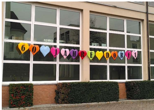
Abgesagte Schulhausfeier: Zu diesem Bild hätten eine dampfende Risotto-Pfanne, duftende Bratwürste und ganz viele Leute gehört, die sich treffen und miteinander plaudern und die Produkte und Darbietungen der Schülerinnen und Schüler bestaunen.